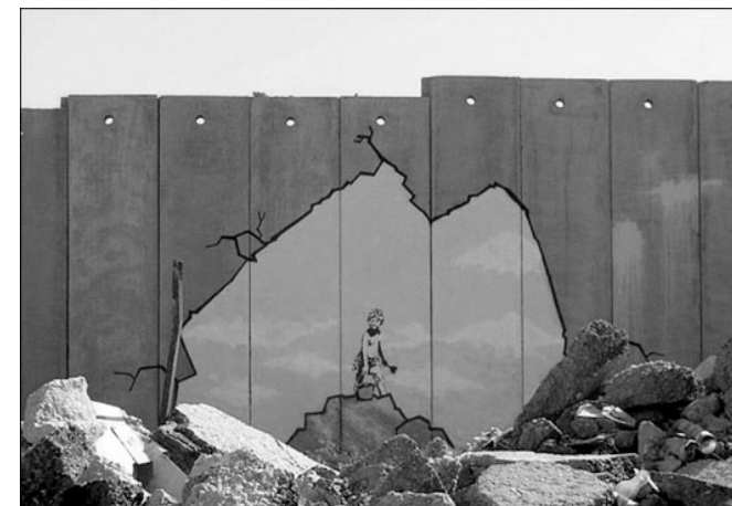
Le mur d'annexion graffitié par Banksy