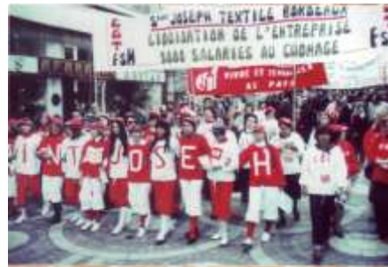
St Jo

Plusieurs moments pour les rencontrer dans le forum.