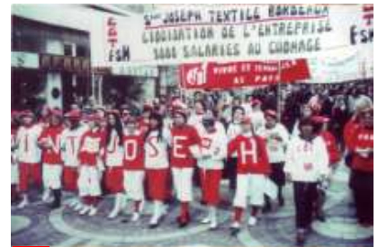
St Jo : Lutte des Saint Joseph à Bordeaux 1976/1984 / Archives de l'IHS CGT33