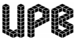
Université Populaire de Bordeaux